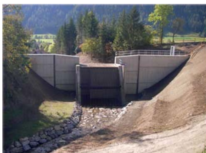
4. ábra: Hordalékfogó és lefolyáskésleltető