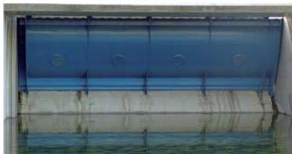
1. ábra: Halhas alakú zsíliptábla

A Steinhardt GmbH hosszú évek óta sikeresen gyárt különféle árvízvédelmi szerkezeteket. Segítséget nyújtunk a tervezéshez, és nem hagyjuk, hogy „összecsapjanak a feje fölött a hullámok”. Szerkezeteink anyaga korrózióálló acél, masszív, tartós, és – ahol csak lehetséges – elektromos áram nélkül üzemel, ami azt jelenti, hogy lakott területtől távol is telepíthetők. A Steinhardt GmbH három fontos árvédelmi szerkezetet gyárt.