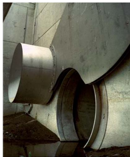
7. ábra: HydroSlide® lefolyásszabályozó