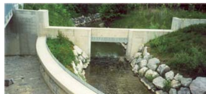
6. ábra: HydroStyx® lefolyáskésleltető