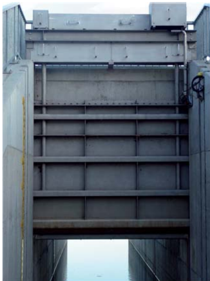
2. ábra: Töltés, ürítés