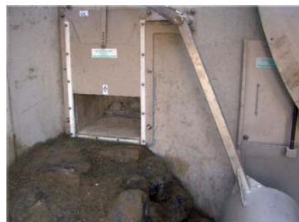
8. ábra: kétélűeknek áteresztő zsílip