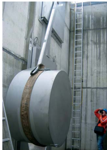
5. ábra: HydroSlide® lefolyásszabályozó